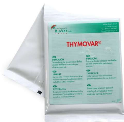
Obal THYMOVAR®u (2 x 5 ks proužků).